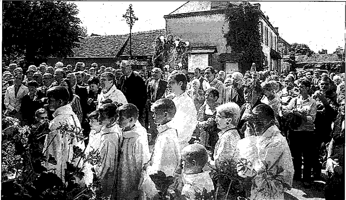
Il y avait foule pour cette cérémonie